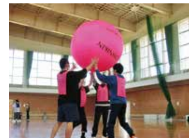
体育スクーリング(キンボール)