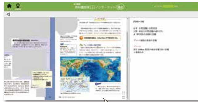
先生の声と板書で丁寧に解説！自分だけの先生です。