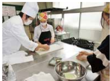
家庭基礎スクーリング