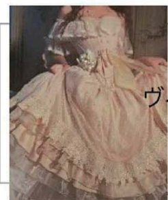
ヴィンテージ ドレス