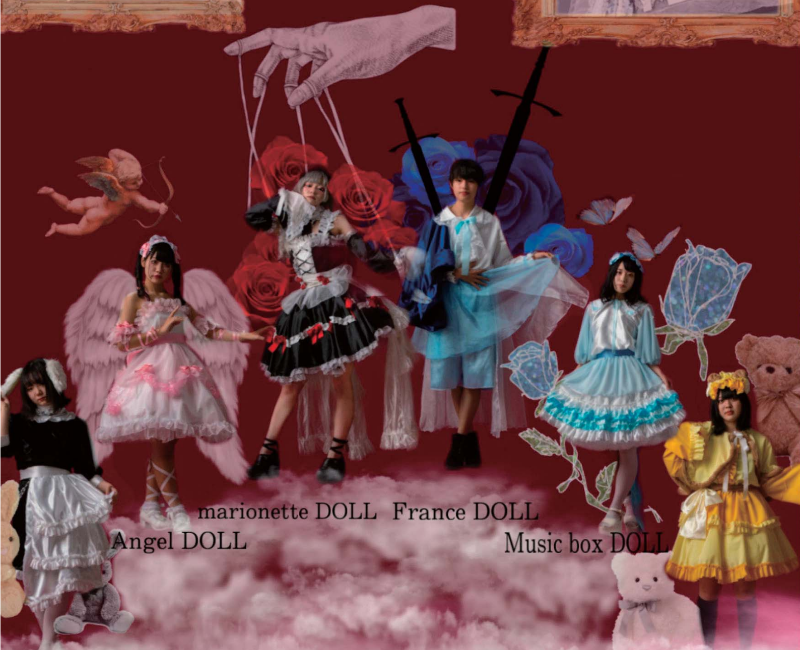
marionette DOLL France DOLL Angel DOLL