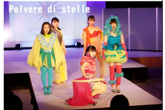
暗闇の中 無限に広がる宇宙。そこには惑星や星が存在し様々な個性を放っています。そんなシェイプ・カラー・ウェーブをデザインしました。