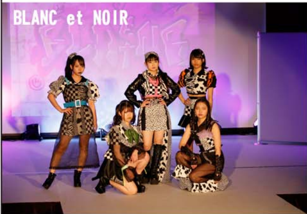
タギング 落書きと言われれば聞こえが悪いですが「芸術の街」としても知られるメルボルンでは、オーストラリアの魅力のひとつとも言われるほど発展し、ストリート・アートとも言われています。私はこのモノトーンのストリートアートに着目しデザインしました。

3年生が卒業製作として各々のブランドを立ち上げ発表する ケイシン コレクション モデルはファッションデザイン科全生徒が担当！