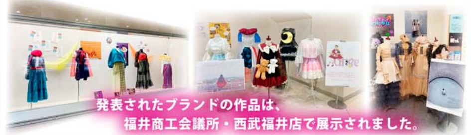
発表されたブランドの作品は、 福井商工会議所・西武福井店で展示されました。

いざ、衣装作りが始まったら想像していたよりも大変でした。でも、少しずつデザインが形になっていくのは嬉しくて楽しくて出来るごとにワクワクが止まりませんでした。モデルの子達に着てもらった時、皆ほめてくれて喜んでくれて、それでまた嬉しくてテンションが上がって 大変だったけど、それ以上に喜びが大きかったです。 いとこがいとこの友達にすざいねって言われた時に、私のことを自慢したという話を聞いて、自慢の人ってというのが嬉しくてすごく喜びました。新聞にも載って、それを親が嬉しそうに見ながら話をしていた たくさん迷惑をかけたけど、 少しでも親孝行ができたかなって思って、嬉しかったです。 たくさんの「嬉しい」が詰まったケイシンコレクションができて良かったです。