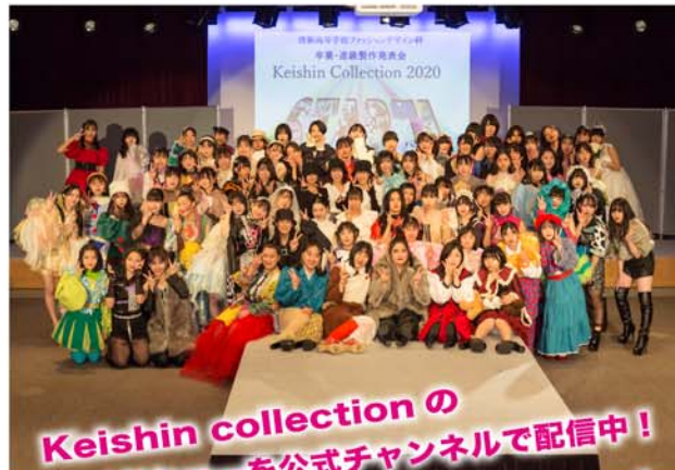
Keishin collectionの スライドショーを公式チャンネルで配信中！ 是非ご覧ください！