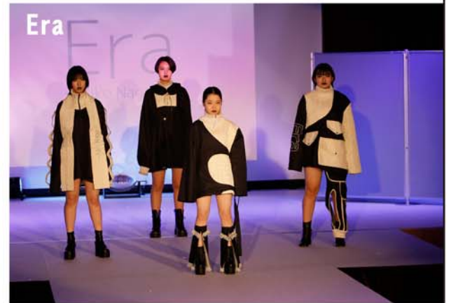
「Era」時代というフレーズからインスピレーションを受けたのはデニムです。質の良さから海外での評判が高い、岡山デニムを採用し製作することにしました。カラーは、藍色をベースに異素材である白ニットとのコラボレーションです。