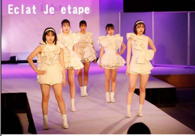
清らかで、キラキラと輝く女性をコンセプトに、ふんわりとした控えめで優しいホワイトに、誰からも愛されるカスミソウをモチーフにしてデザインしました。