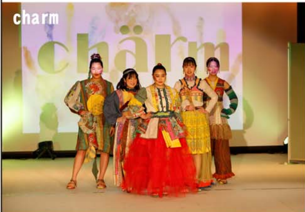
「カーニバル」それは民族衣装を身にまとい仲間と陽気に楽しむひととき。キラキラした、その瞬間を大切にしたい想いからデザインしました。