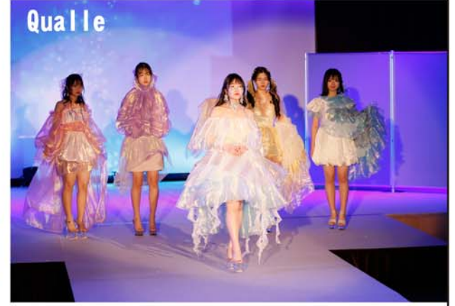
ふわふわと深海を漂うクラゲたち。いろんな色で、キラキラ光っているものや、繊細なものまで、それぞれ色んな魅力があります。見ているだけで癒されてしまう幻想的なクラゲの世界を基にブランドを立ち上げました。