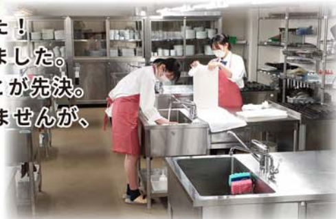
調理科 実習前後には調理室内を消毒

この時を心待ちにしていました！ 生徒の熱で校舎に活気が戻りました。 1年生は高校生活に慣れることが先決。 過ぎ去った2ヶ月は戻ってきませんが、 その分、残りの10ヶ月、 3年生は実質8ヶ月を 12ヶ月分の濃さでいこう！ 長さじゃなくて内容が大事。 制限はあるものの、知恵と工夫で 思いっきり高校生活を楽しもう！