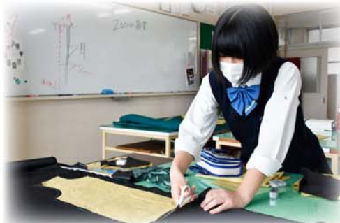
ファッションデザイン科 ハロウィンに向け衣装を製作中